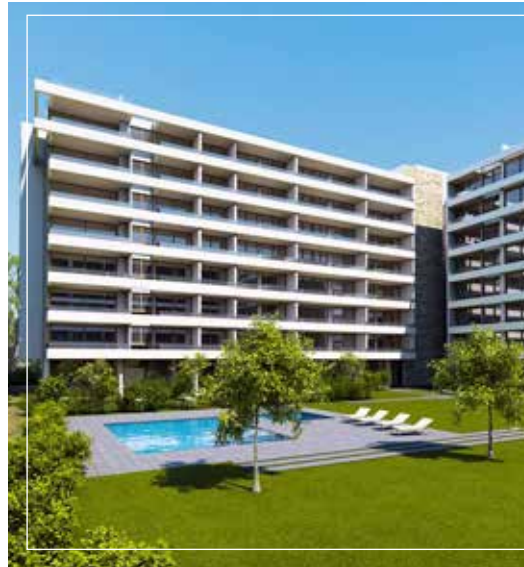
• Piscina para niños

EDIFICIO con inmejorable cercanía y conexión con el barrio y la ciudad. Próximo a importantes vías de acceso como Av. La Dehesa, Av. Las Condes y Costanera Norte.