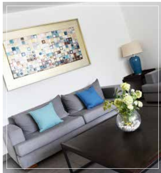
• Lobby amplio y finamente decorado