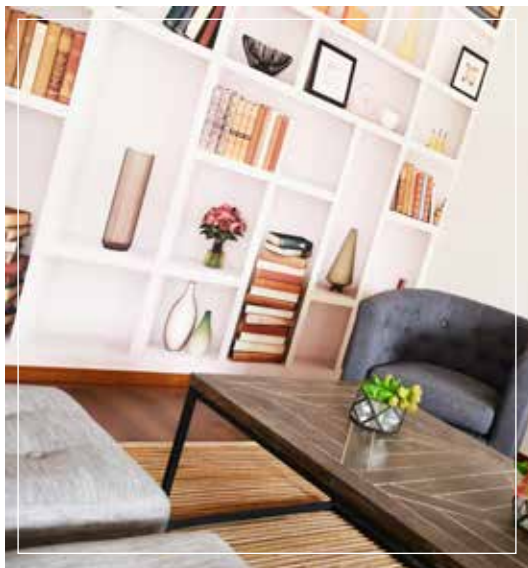
• Cómodo Salón Lounge de lectura