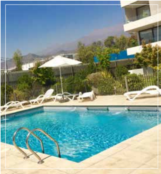
• Agradable piscina rodeada de jardines