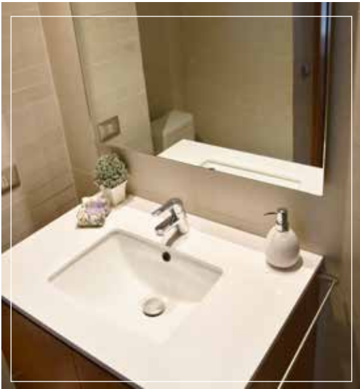
• Baño amplio y full equipado