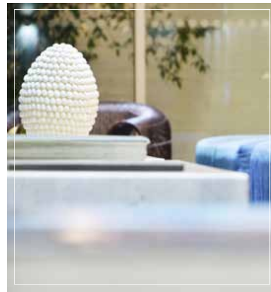
• Finos detalles decorativos