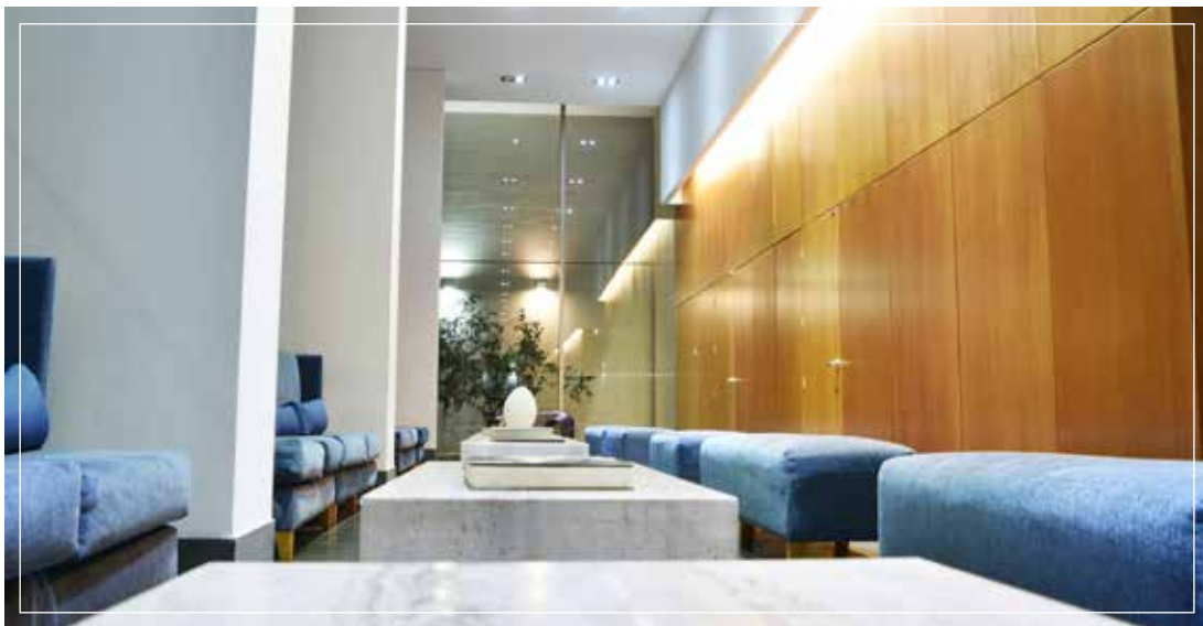
• Amplio e iluminado lobby para un momento de lectura