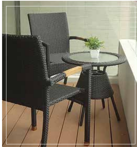
• Amplia Terraza