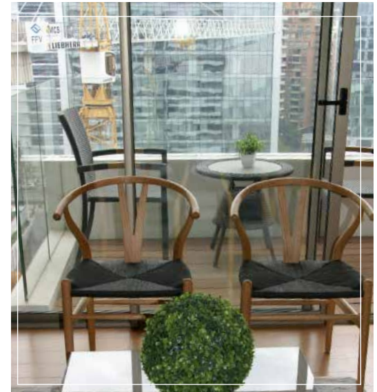
• Cómodo Salón Living